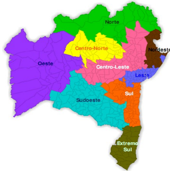
Figura 1. Microrregiões de Assistência em Saúde da Bahia.