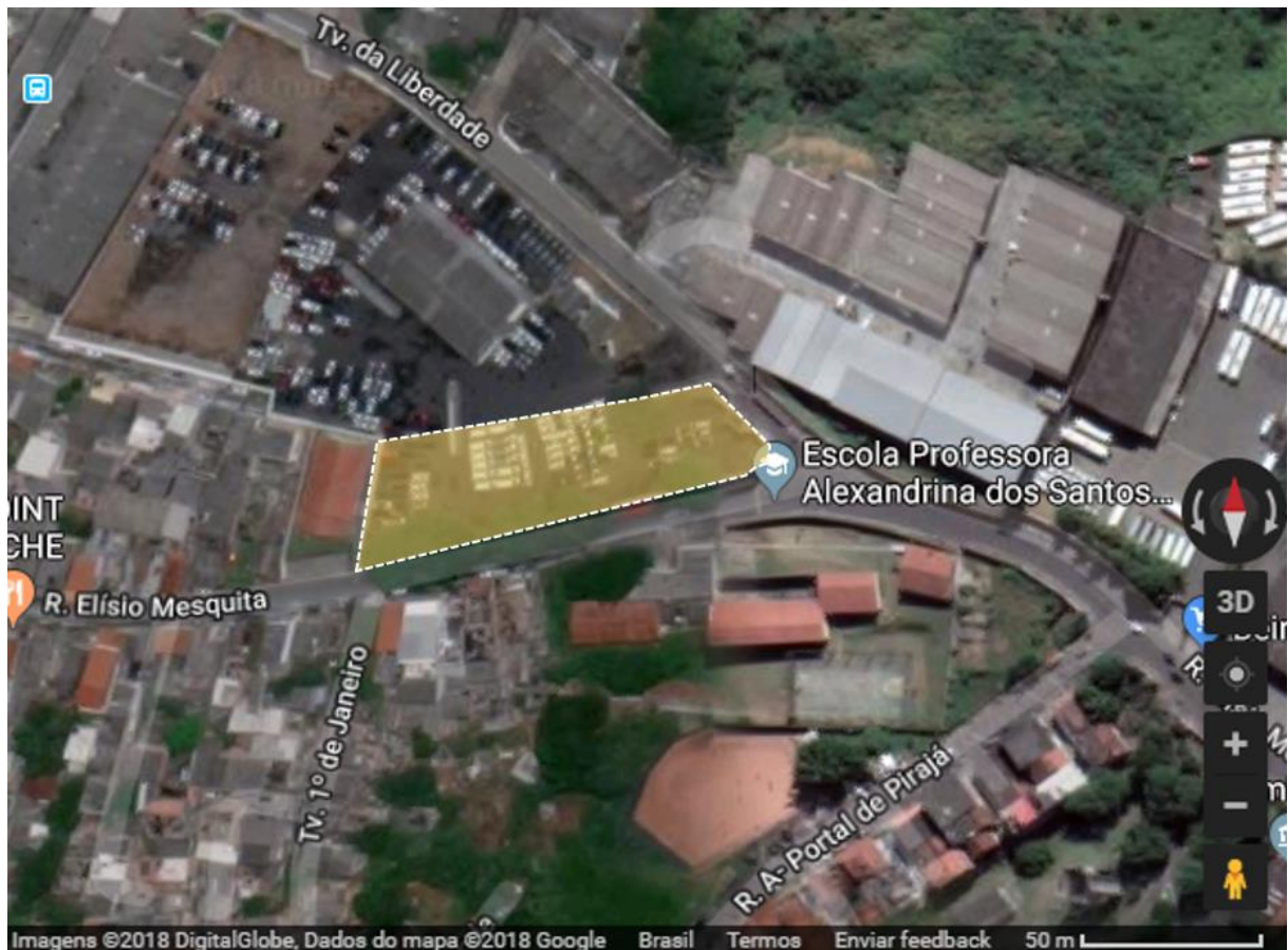
MAPA DE LOCALIZAÇÃO DO TERRENO