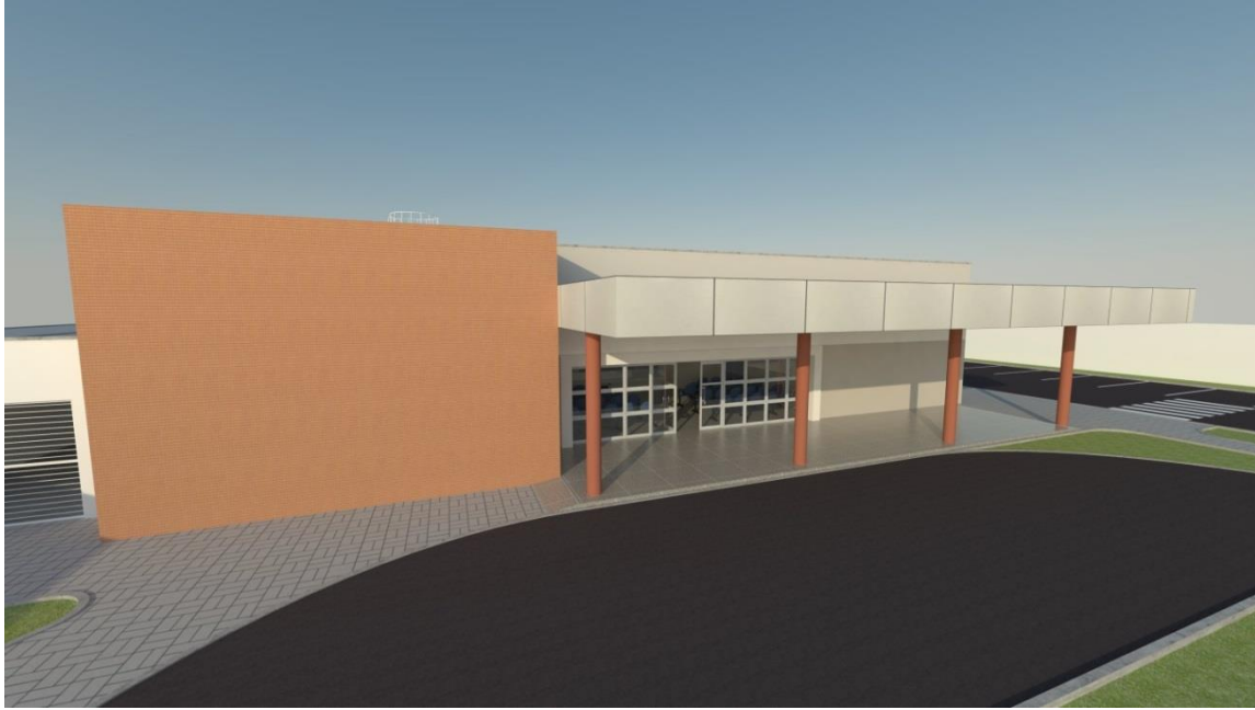
Fig. 01 – Volumetria da UBS (Fachada Principal)