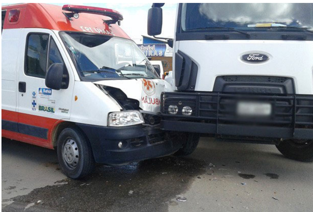
Enfermeiro do Samu fica ferido em batida a caminho de atendimento.

A ambulância estava a caminho de um atendimento, para socorrer um homem que caiu de um andaime. A vítima foi atendida por uma outra equipe e passa bem, informou o Samu. Outras duas pessoas estavam na ambulância no momento da colisão, mas elas não ficaram feridas. O motorista do caminhão também não ficou ferido. A causa da batida ainda é desconhecida. O nome das vítimas não foi divulgado.