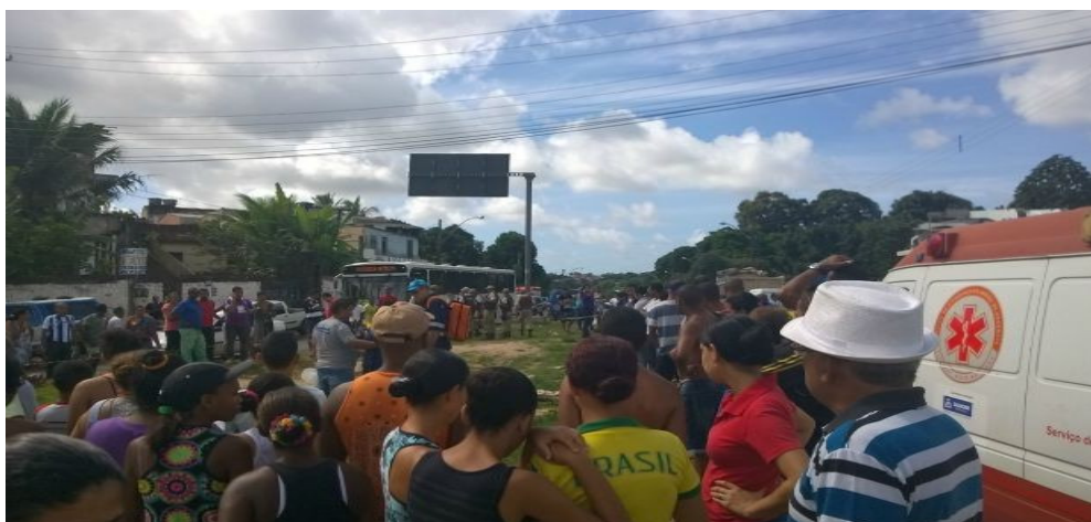
Equipes dos Bombeiros fizeram o resgate dos corpos