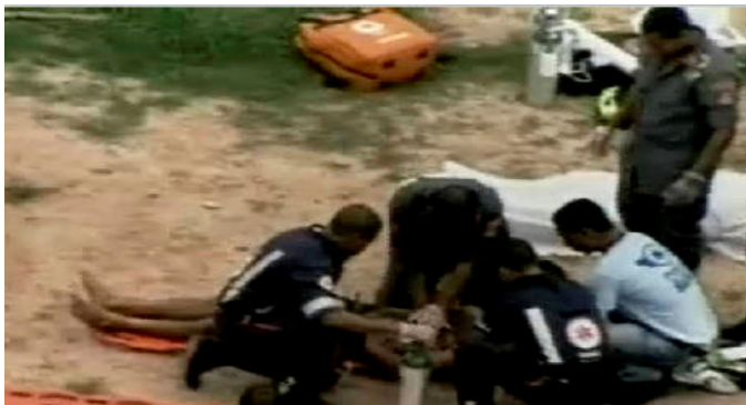
Resgate no bairro de Cajazeira

Duas vítimas era terceirizados da Embasa