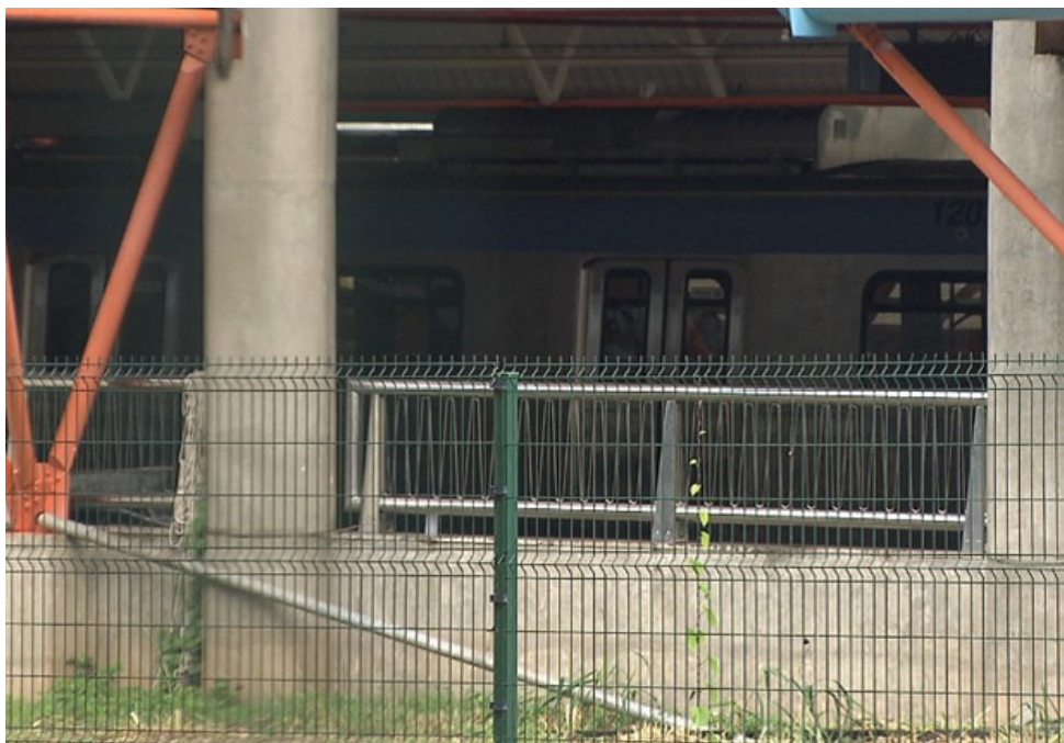
Morte ocorreu na área operacional dos vagões.

De acordo com o MPT, juntamente com este, outro inquérito será instaurado para apuração da interdição por questões de segurança, ocorrida há três semanas, de uma frente de trabalho das obras do metrô que foi embargada .