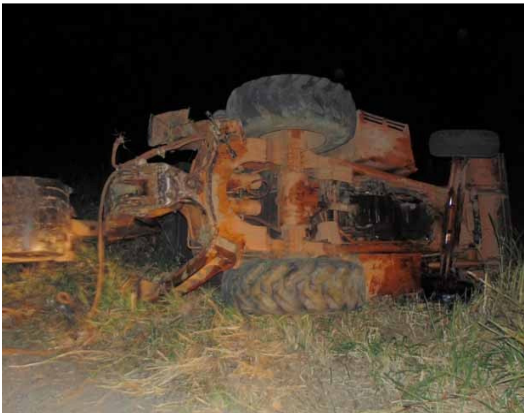
Homem morreu após ser atingido por retroescavadeira na BR-330

Um homem morreu após ser esmagado por uma retroescavadeira na noite de segunda-feira (22), na BR-330, trecho entre os municípios de Ipiaú e Jitaúna,