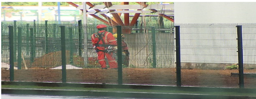
Morte ocorreu na área operacional dos vagões do metrô de Salvador

Superintendência do Trabalho fez vistoria para apurar causas do acidente. Segundo técnicos, pode ter ocorrido falha em equipamento de segurança.