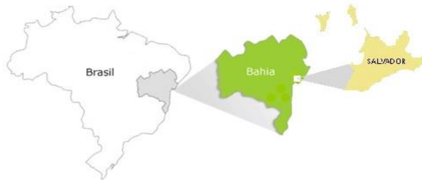
Imagem N° 1: Localização do município de Salvador

O município de Salvador localiza-se nas coordenadas 12° 58' 16" de latitude sul e 38° 30' 39" de longitude oeste.