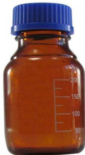
Fig.01. Frasco para coleta de água

TIPO DE RECIPIENTE: Frasco de vidro âmbar pequeno (200 ml) fornecidos pelo LACEN-BA.