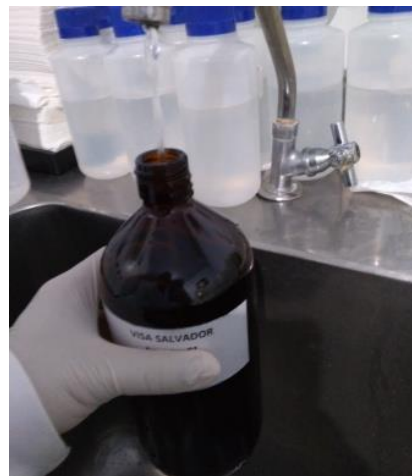
Fig.02. Fluxo da água para coleta