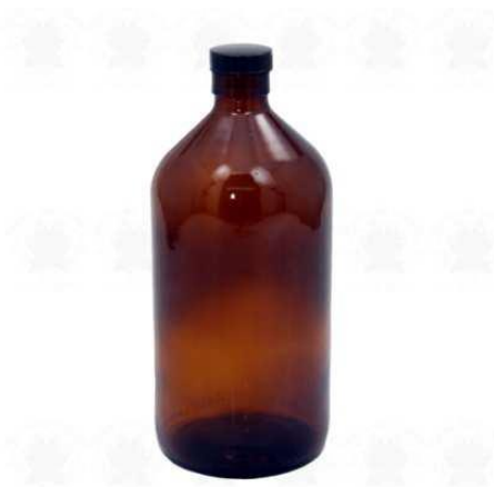
Fig.01. Frasco para coleta de água

TIPO DE RECIPIENTE: Frasco de vidro âmbar fornecidos pelo LACEN-BA.