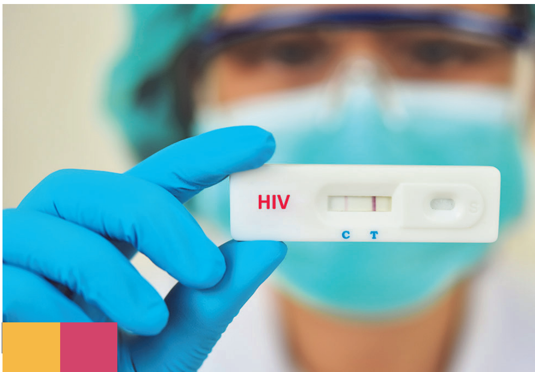
Tabela 2. Tipos e características das intercorrências com TRs