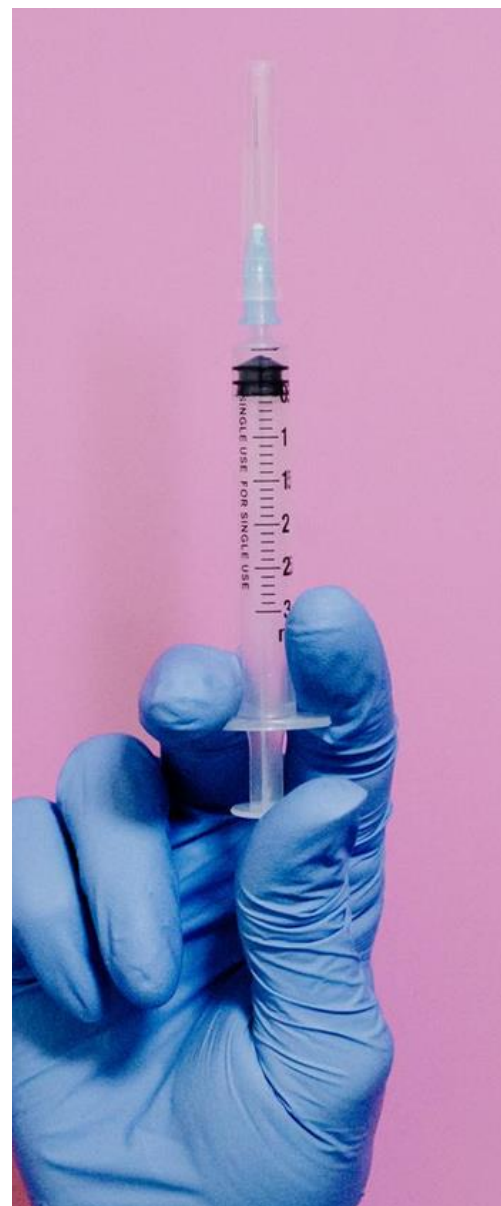
Casos Confirmados Hepatites A, B e C - 2024

No Brasil a distribuição proporcional dos casos varia entre as cinco regiões (Brasil, 2024). Na Bahia observamos a ocorrência das hepatites A, B e C, havendo maior proporção das infecções pelo vírus B e C (Bahia, 2024).