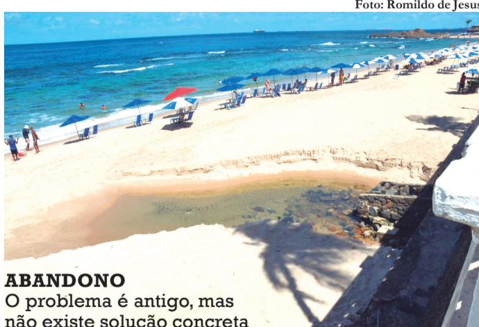
ABANDONO O problema é antigo, mas não existe solução concreta

Ele alerta que os impactos vão muito além do transcurso visual e representam um risco direto aos ecossistemas costeiros. "Quando esse tipo de descarga ocorre de forma recorrente, há comprometimento da qualidade da água e danos ao ecossistema marinho, que perde capacidade de se recuperar e de sustentar as atividades