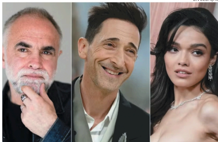
Karim Ainouz vai dirigir os atores no filme Last Dance , que adapta um artigo de revista New Yorker

Na trama, pai e filha embarcam em uma viagem pelo Caribe em um cruzeiro gay. Única pessoa heterossexual a bordo, Emma acaba tendo