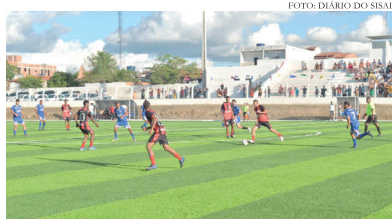
Estádio Municipal Renatão

No ano em que acontece a Copa do Mundo, não podia faltar a combinação de futebol e música, que representam duas das maiores paixões dos brasileiros. Na cidade de Ichu, isso se confirmou nesta sexta-feira (29) com a reinauguração do Estádio Municipal Renatão, que passou por reformas para aprimorar e modernizar sua infraestrutura. A cerimônia, liderada pelo prefeito José Gonzaga Carneiro, contou com a presença de atletas, esportistas, autoridades, cidadãos e representantes da Superintendência dos Desportos do Estado da Bahia - SUDESB. A esperada presença do governador Jeronimo Rodrigues não aconteceu.